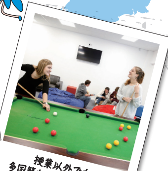
授業以外にも 多国籍な留学生と交流!