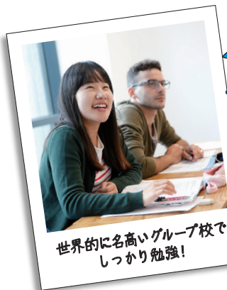
世界的に名高いグループ校で しっかり勉強!