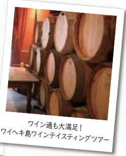
ワイン通も大満足! ワイヘキ島ワインテイスティングツアー