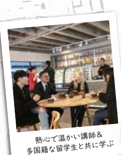
熱心で温かい講師 & 多国籍な留学生と共に学ぶ