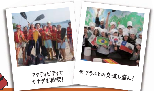
アクティビティでカナダを満喫!