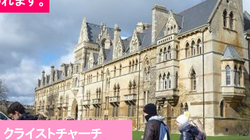
クライストチャーチ